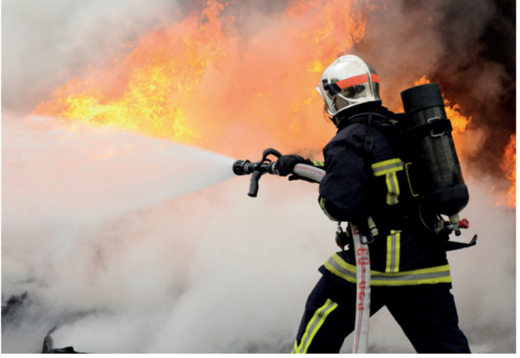
SPORTS & SAFETY